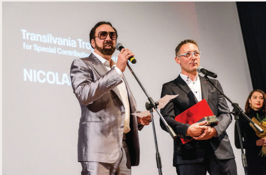
Superstarul Nicholas Cage a primit aseară, la Cluj, în cadrul TIFF'18, trofeul „Transilvania” pentru Contribuția Specială adusă Cinematografiei Mondiale