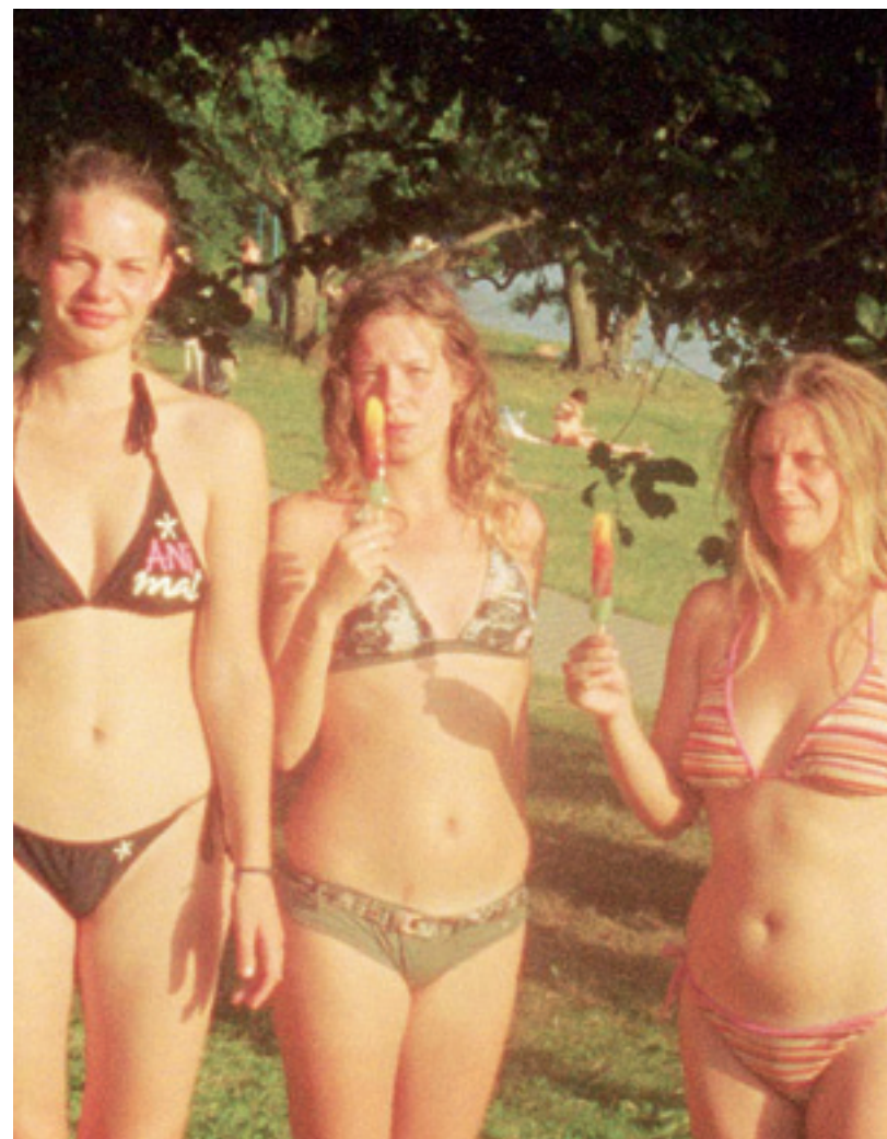
Noua viață a albumului de familie