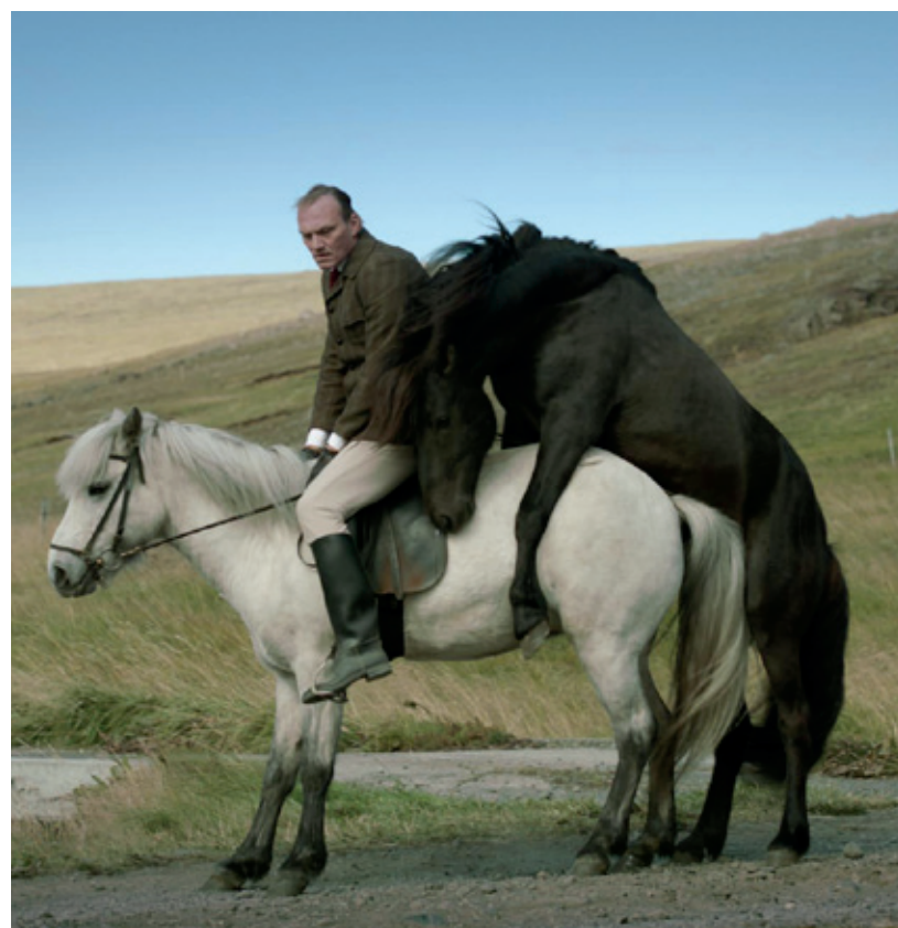
Of Horses and Men

Try not to miss Hüseyin Karabey's Come to My Voice , a moving, gorgeously shot story of a Kurdish village in Turkey forced to deliver weapons they don't have in exchange for their menfolk, wrongfully arrested by the occupying army. Weaving storytelling, music, and landscape's determining factor in a people's culture, this is an enriching film and a highlight of my Berlinale this year. It seems odd pairing it in the same paragraph with Câinele Japonez ( The Japanese Dog ), although both films have a senior citizen as the lead protagonist. In very different ways, they also both have something meaningful to say about our connection to the land, and a past we're unable to control. When