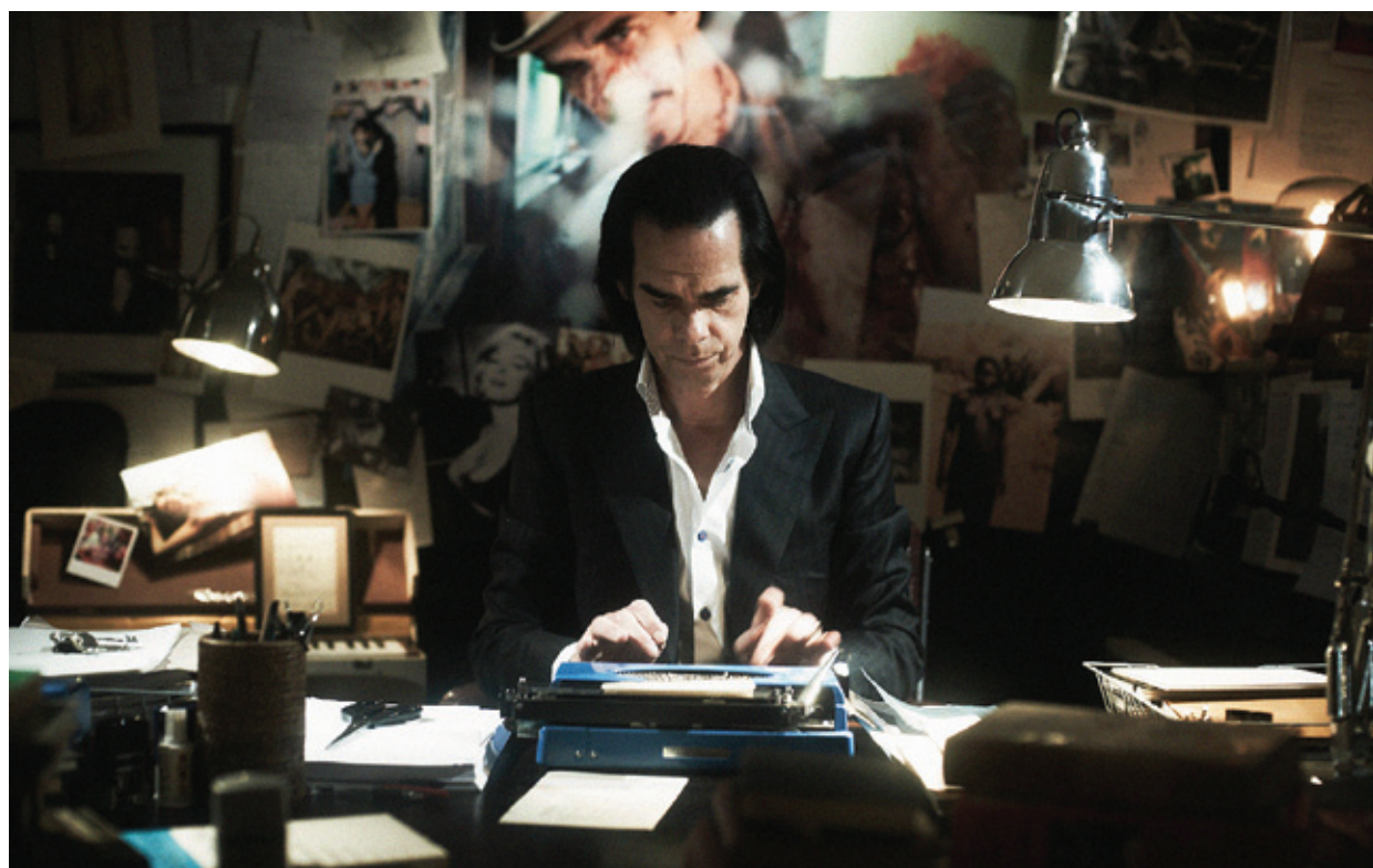
20.000 de zile pe Pământ

Și-acuma ce ne facem? e întrebarea pe care un documentar bun ți-o împlântă-n creier. Ce facem ca să schimbăm, să îmbunătățim, să revoluționăm? Cum facem să fie bine?