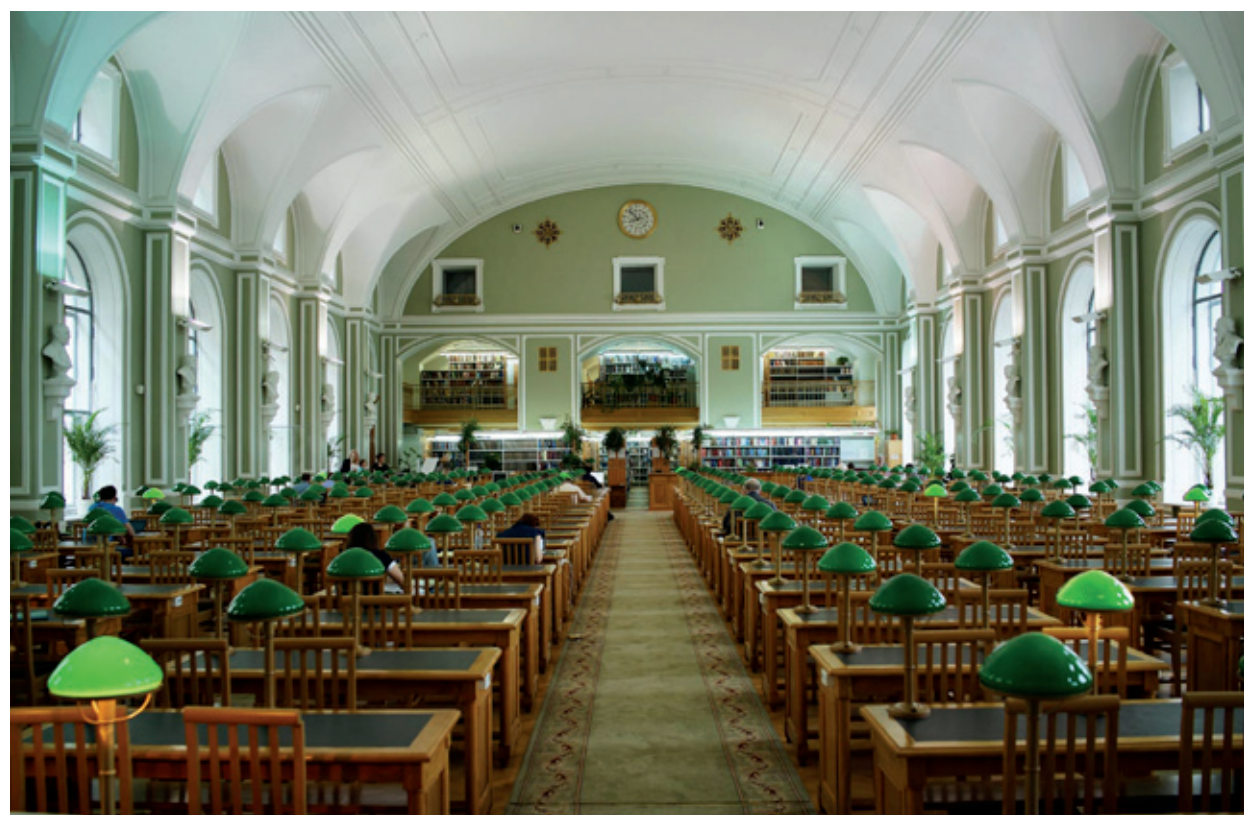
Cathedrals of Culture

Originally, he had considered the I.M. Pei-designed National Center for Atmospheric Research in Boulder, Colorado, „but then everything came together when I thought of the Salk Institute [of Biological Studies] because I had grown up nearby and remember seeing the building being constructed."