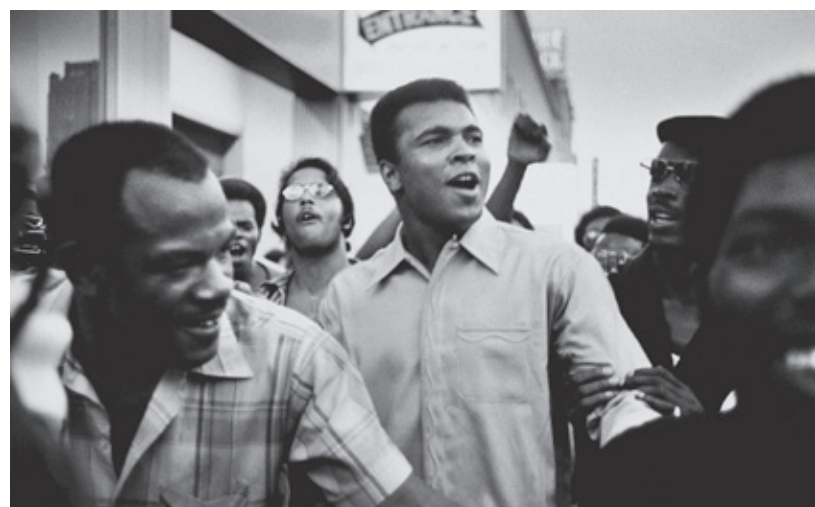
Procesele lui Muhammad Ali

Despre violență vine cu o compilație nemaivăzută de imagini filmate de televiziuni suedeze în Tanzania/Rhodesia/Angola/Zimbabwe și Mozambic în anii '70. Ele curg sub lecturarea de către Lauryn Hill a unui text extrem de activist despre decolonializare (în ultimă fază prin violență) scris și imediat interzis de Frantz Fanon în 1961. Ce rezultă este un film-eseu în niște imagini absolut zguduitoare.