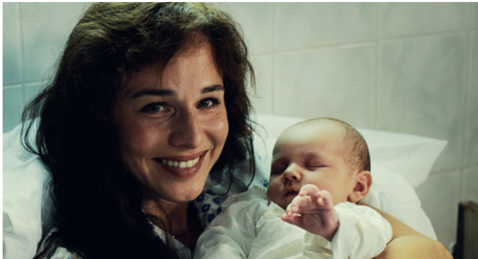
De ce fierbe copilul în mămăligă

Patria, sexul și alte inconveniente începe unde se termină Aglaja , respectiv în Germania. Aici un el (actorul tată din Aglaja ) și o ea se găsesc stabiliți tot în Germania, dar de această dată într-un exil autoimpus datorat mirajului vestului într-o lume cît se poate de contemporană. Fiica, deci, balerează în germană, în timp ce soțul și soția nu-și pot consuma căsătoria din pricina viziunilor diferite despre viața în pribegie. După o mică petrecere petrecută cu prietenii în limba maghiară, lucrurile deodată se reaprind pe măsură ce impotența exilului își reduce tăișul lingvistic. Pentru ea "patria" e identitatea, copilăria, mirosuri, lumini și limba, pentru el "homeland" e unde-și pune capul în pernă. Ea vrea înapoi