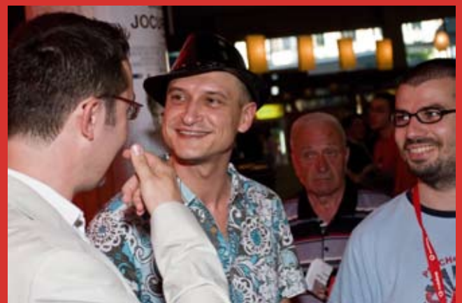
Directori de festival...