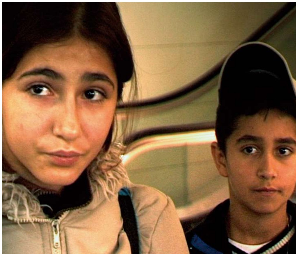
Kenedi se-ntoarce acasă

Problema cu rromii este că au fost prea „povestiți” în campanii sociale ușor agresive. Efectul: o imagine dulceag-pacifistă care a îndreptat lucrurile spre o zonă aproape la fel de nocivă ca discriminarea negativă: discriminarea pozitivă. Așadar s-au spus multe despre rromi, dar nu încă destule și nu încă așa cum trebuie.