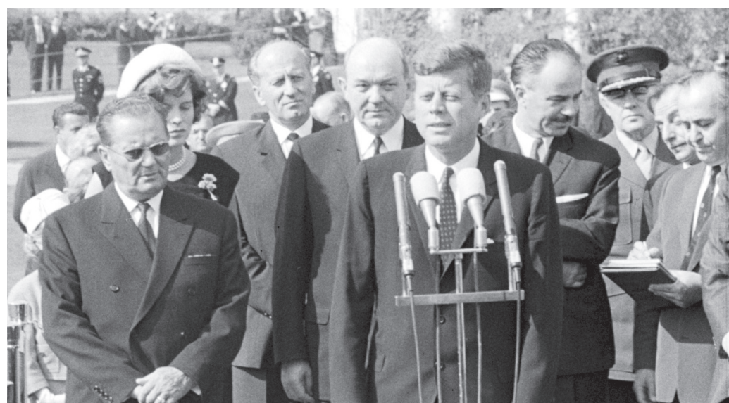
Houston, We Have a Problem!