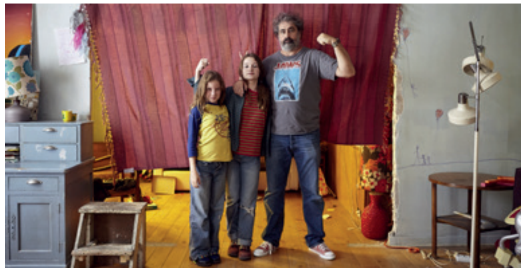
O familie fabuloasă