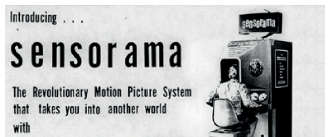
Afiș publicitar al unei proiecții VR din anii '60