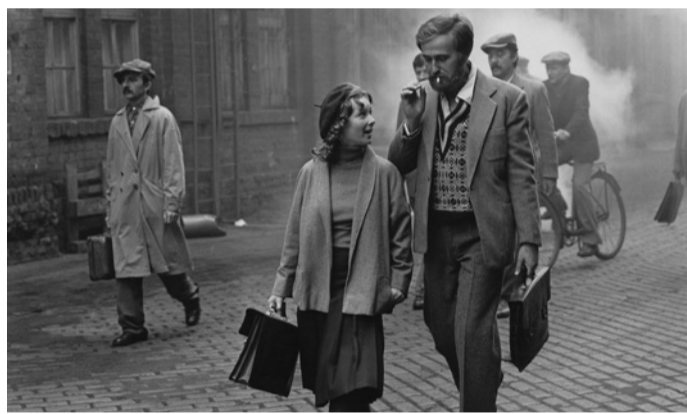
Jurnal pentru copiii mei

care doar câteva alte cineaste făceau același lucru în toată Europa (poate doar Agnès Varda, Kira Muratova, Larisa Shepitko). Eroinele filmelor ei au fost mereu genul de persoane puternice, dar totodată fragilizate de un context vitregit, care trebuie să lupte atât cu preconcepții sociale, cât și cu necazuri existențiale.