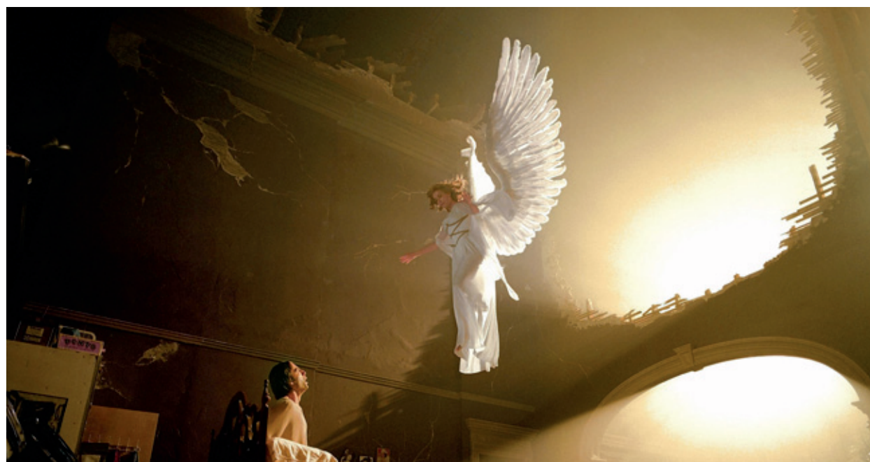
Angels in America