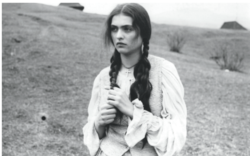
Lumina palidă a durerii