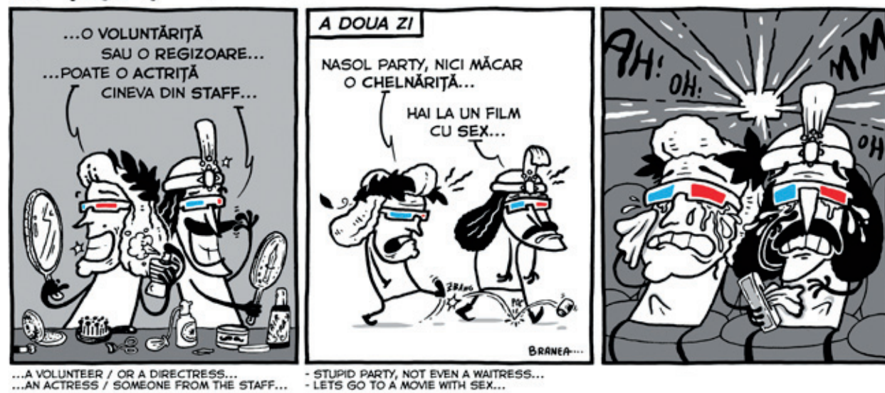
...A VOLUNTEER / OR A DIRECTRESS... ...AN ACTRESS / SOMEONE FROM THE STAFF...