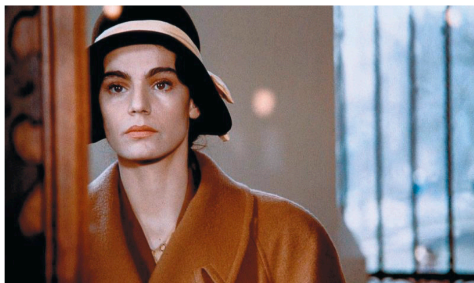
Maia Morgenstern (A șaptea cameră)

„Părinții nu m-au ajutat la școală, la desen. Credeau foarte tare în autonomia creativității. Sună complicat și pompos. Era voie de scris pe pereți. Era voie de desenat pe pereți. Era cum cred, cum simt. Veșnic amestecam culorile. Dar restul era Nu. Înghețata, nu, să nu fac roșu în gât, am fost și un copil bolnăvicios. Nu se întârzia acasă. Ai spus o vorbă, ține-te de cuvânt. Când eram mai mărișoară și când eram mai mică. Nu se merge la masă fără să fie mâinile spălate. Tata îmi spunea Nu, dar nu cu agresivitate. Era Nuuu, un fel de melodie.” – Maia Morgenstern, Interviuurile lui Vitalie, PRO TV