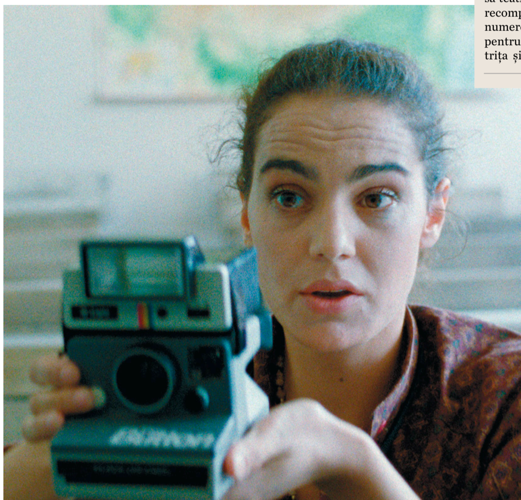
Maia Morgenstern (Balanța)

Contribuția imensă adusă culturii române de îndrăgita actriță Maia Morgenstern va fi omagiată cu Premiul de Excelență la Gala de Închidere TIFF 2022 din această seară ca semn de recompensă pentru cele patru decenii de carieră dedicate scenei și marelui ecran.