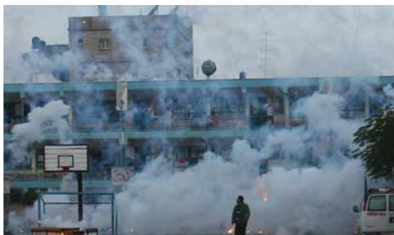
Tears of Gaza