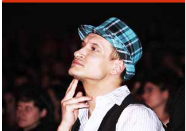
Directorul artistic