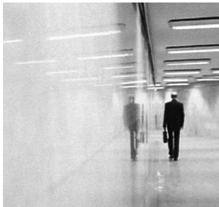
Frica domnului G

Patru ore de filme scurte - împărțite pe patru programe, toate la cinema Victoria pentru harnici sau pentru somnanbuli (prima proiecție începe la 10 dimineața). Oferta este cel puțin atrăgătoare. Iată câteva indicii: Passagen e un film despre niște peruani umblați prin lume, care stau și rîd de ciudașenile care le-au întîlnit în România exact cum am zice noi că nemții sînt încuiați sau chinezii sînt mici și rîd ca timpîții despre orice, numai că aici nemții și chinezii sîntem noi, iar sentimentul e straniu de reconfortant. Cimitirul vesel din Săpînța lui Stan Ioan Oncu cu arta lui naivă și poeziile despre morți e un subiect care poate fi exploatat în moduri inedite și, ciudat, nu a mai fost de prea multe ori pînă acum. doc vă invit să îl vedeți singuri pornind de la ideea că o privire asupra pornografiei românești nu poate fi altfel decît intrigantă, interesantă, deprimantă, șocantă sau complet surprinzătoare. Marilena de la P7 a lui Cristian Nemescu e un mediummetraj care la Cannes s-a văzut cu sălile pline și la care s-a aplaudat mult. S-a spus, de asemenea, că e un film fără greșală. O poveste vibrantă despre un ghetou de la marginea Bucureștiului (în care de exemplu un bunic hîrșit de viață, șmecher și misogin, își cultivă grădinața pe betoanele acoperișului unui bloc), cu un puști ce ar face orice - furat tot salariul părinților sau chiar un troleibuz pentru adorata inimii - și o prostituată fișneată de la P7. Actori copii cu un talent ingenuu,