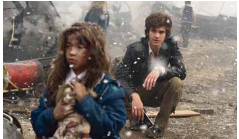
Red Riding: In the Year of Our Lord 1974

cînd să renunțe. Deci bun venit în Anno Domini 1980, cînd o altă investigație este în plină desfășurare. Oridinul venit de la centru cere ca Peter Hunter (Paddy Considine) să evalueze eforturile polițienești care nu duc la prinderea unui alt cîrminat în serie. Hunter are antecedente non-amicale cu băieții guantanamoști avant la lettre de la secție și descoperă că una dintre prostituatelor ucise nu era prostituată și că anumite dovezi sînt suspect de convenabil amplasate. James March (el a filmat Man on Wire ) abordează cu un rafinement vizual memorabil un story cu tente lynchiene. Al treilea Red Riding , amplasat la numai 3 ani distanță (deci 1983) îi este încredințat spre regizare lui Anand Tucker. Care, în mod surprinzător pentru un autor de filme romantice ușurele ( Shopgirl , Leap Year ) oferă o încheiere feroce, nihilistă și derizorie dosarului deschis cu 9 ani în urmă. Privit din mijlocul eliei polițienești, eșafodajul construit din cadavre de martori incozomi și mușmalizări convenabile începe să se clatine. Iar una dintre bestiile în uniformă prezintă îngrijorătoare puseuri de conștiință. Deci, da, neo-noir-ul poate fi mai acut, feroce și acerb decît "capodoperele genului". ■