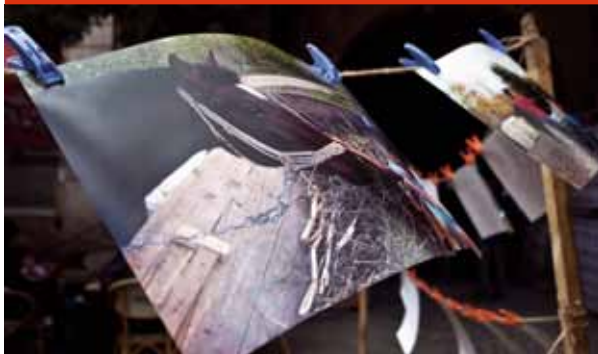
Expoziția de fotografie Gypsy