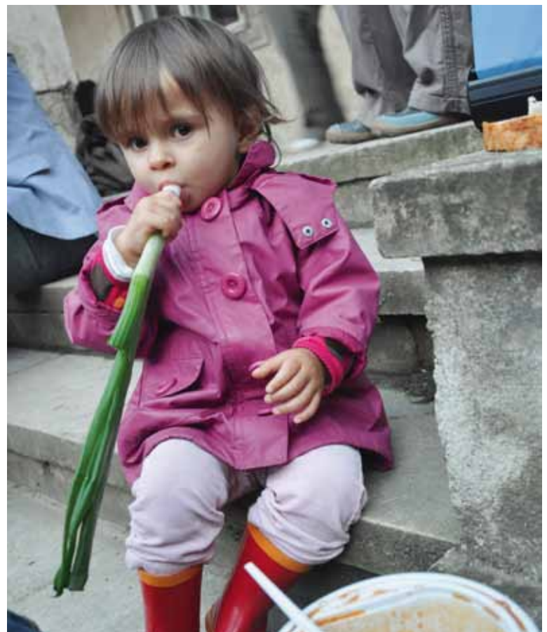
No, ce bun îi gulașu!...