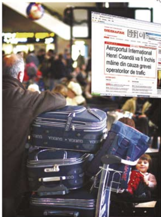
Peste 80% din știrile din presa de azi au fost publicate de ieri de Mediafax. Intră acum pe www.mediafax.ro ca să citești presa de mâine. Află primul!

DACĂ AI FI ȘTIUT CU O ZI ÎNAINTE... MEDIAFAX