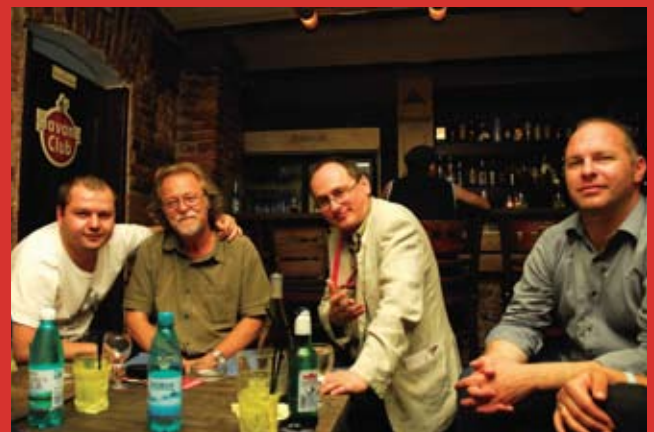
Bun venit în Zilele Filmului Românesc...