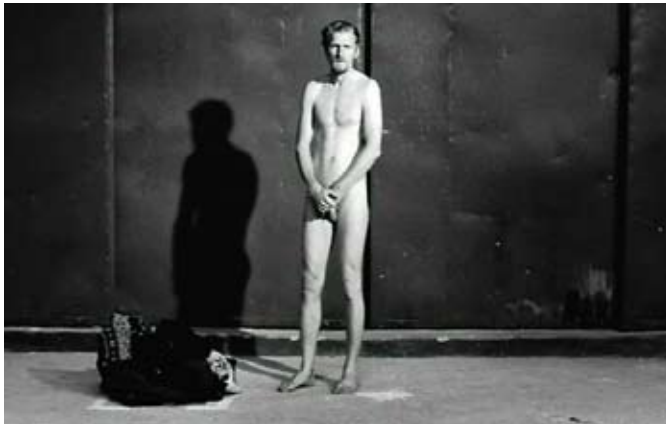
Rien ne va plus

Cele trei programe de scurt metraje românești conțin filme de școală, fragmente de lumi și experimente imagistice, care au luat premii pe la varii festivaluri internaționale (Cannes, Berlin, Locarno) și care de obicei preced debutul în lung metraj al cineaștilor care contează. Durează puțin, se consumă fără mari bătăi de cap și spun multe despre cinema-ul românesc. Aveți acces la gândurile mici din mintea unor oameni care e foarte posibil să devină mari. Iată cum arată ele și ce motive aveți să le vedeți: