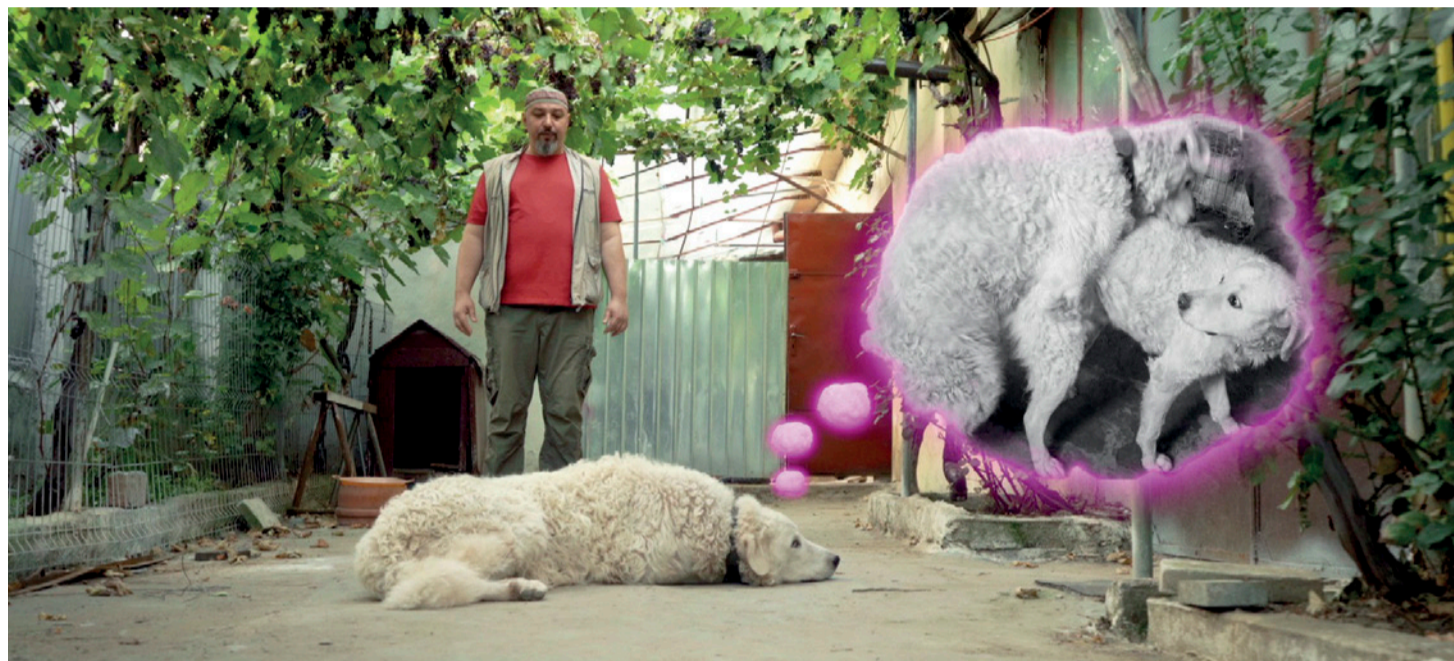
Al cui câine sunt?

trebare și am crezut că această temă poate fi discutată și prin prisma creșterii câinilor. În același timp, m-am gândit că acest lucru poate fi și o critică a societății transilvănene, deoarece nu numai reglementările fac imposibilă această idee, ci și modul în care maghiarii transilvăneni se raportează la proprii lor câini ciobănești. Este complet ilogic să castrăm cele mai bune exemplare, acesta este corespondentul selecției sociale. Deci, am simțit că există un film aici, iar firul personal de a căuta o mireasă pentru câinele meu a fost introdus doar din motive de dramaturgie.