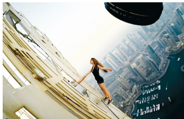
What a Fantastic Machine

The festival, let's not forget, is also a catalyst for providential encounters, where true love stories between TIFF-goers have happened over more than 20 editions.