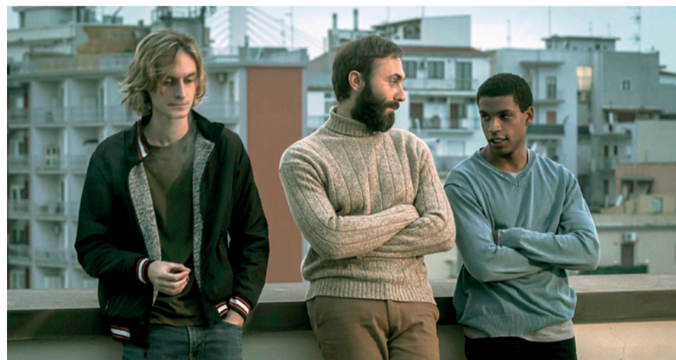
Darko Perić poate fi văzut în „Regula dintăii”, vineri 16 iunie la Cinema Mărăști

italiancă. Până acum am văzut 3 filme, mai am 9 filme din competiție. Duminică m-am dus să văd și concertul și filmul vechi, Manasse , din '25, foarte fain. Despre filmele pe care le-am văzut până acum pot spune că toate sunt diferite. Un film din Argentina, unul din Cehia și azi unul din Danemarca. Acum cred că urmează unul din Croația și după aceea unul din Nicaragua, deci clar filme diferite. Nu pot să zic că unul e mai bun. Trebuie să le văd pe toate și să diger un pic, toate sunt interesante, mai ales că prezintă realități diferite.