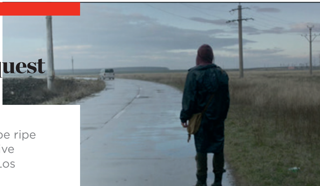
4.15. pm The End of The World