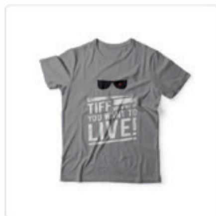
Tricou Terminator 35.00 lei