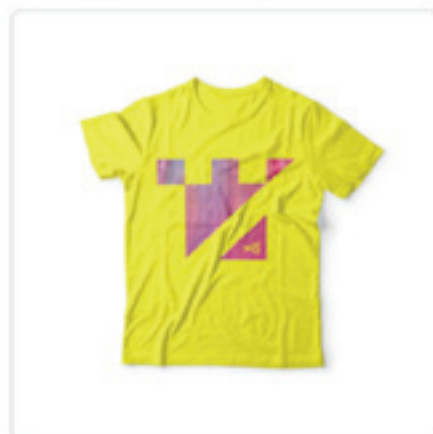
Tricou unicat Tiff 2016 50.00 lei