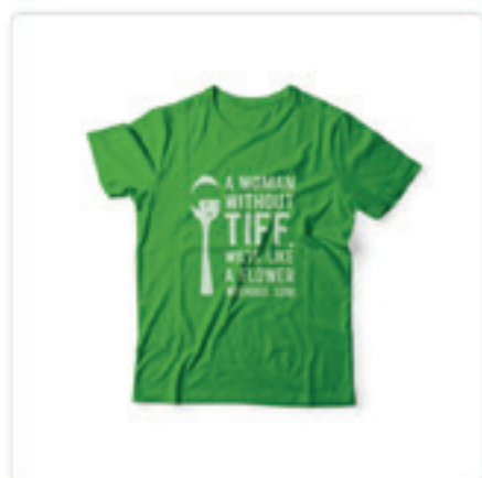
Tricou Amelie fete 35.00 lei

Did you miss the Tiff goodies!?! No worries: you can now find us online @ shop.tiff.ro