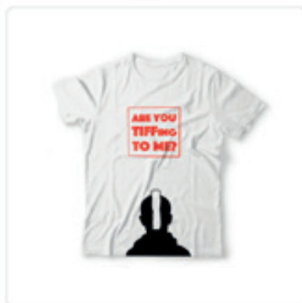
Tricou Taxi 3 35.00 lei