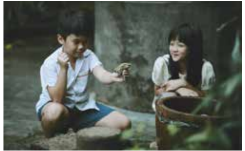
FLORI GALBENE PE CÂMPIA VERDE

Marina este o tânără cântăreață aspirantă. E îndrăgostită de Orlando, un bărbat cu două decenii mai în vârstă. Orlando moare pe neașteptate și, în loc să-și plângă iubitul, Marina trebuie să înfrunte suspiciuni. Marina este o femeie transexuală și pentru rudele lui Orlando identitatea ei sexuală este o aberație, o perversiune. Cel mai nou lungmetraj al regizorului Sebastián Lelio, câștigător al Trofeului Transilvania în 2007 cu Familia sfântă! Marina is a young aspiring singer. She loves Orlando, a man 20 years older than her. Orlando suddenly dies and, instead of being able to mourn her lover, Marina has to fight suspicion. Marina is a trans woman and for most of Orlando's family, her sexual identity is an aberration, a perversion. The latest feature of Sebastián Lelio, winner of the Transilvania Trophy in 2007 with La sagrada familia!