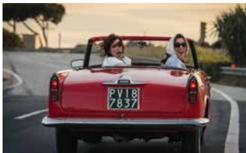
NEBUNE DE FERICIRE