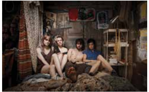
CEI CARE FAC REVOLUȚIE PE JUMĂTATE ÎȘI SAPĂ SINGURI GROAPA

Un hoț aristocratic, un evadat și un fost polițist alcoolic își intersectează drumurile în timpul