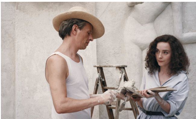
Leonora in the Morning Light

The movie Leonora in the Morning Light distributed by Transilvania Film is playing in theaters starting June 12.