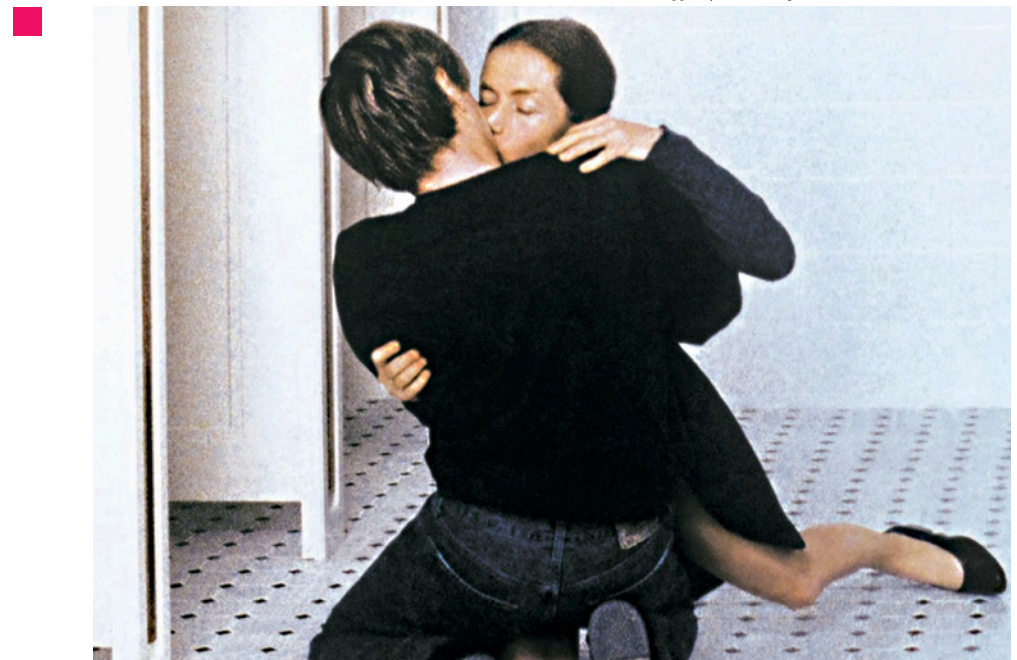
Isabelle Huppert și Benoit Magimel în Pianista , r. Michael Haneke